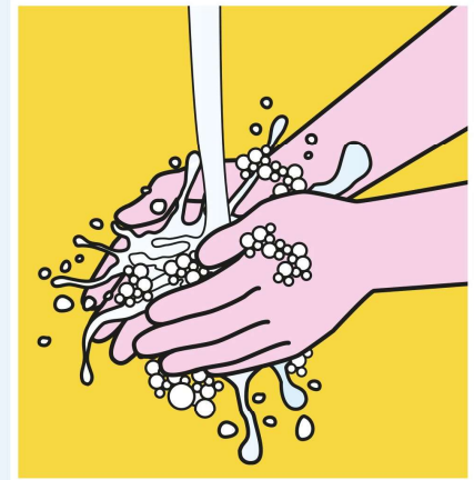
HÄNDEWASCHEN NICHT VERGESSEN