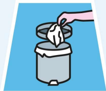
IN DEN MÜLLEIMER WERFEN