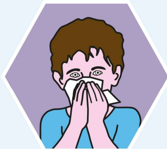
IN EIN PAPIERTASCHENTUCH