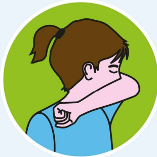
IN DIE ARMBEUGE